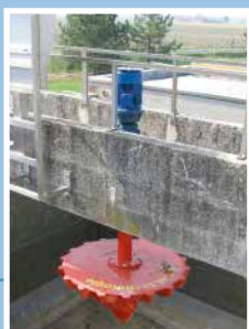
Aérateur de surface fixe type ASP-V, installé sur passerelle en béton. Instalación de aireador de superficie modelo ASP-V, versión fija.