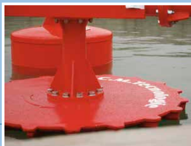
Aérateur de surface flottant type ASP-V. Instalación de aireador de superficie modelo ASP-V, versión flotante.