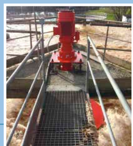
Aérateur de surface fixe type ASP-V, installé sur passerelle en béton. Instalación de aireador de superficie modelo ASP-V, versión fija.