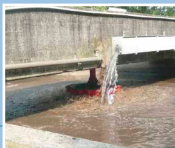
Aérateur de surface fixe type ASP-V, installé sur passerelle en béton. Instalación de aireador de superficie modelo ASP-V, versión fija.