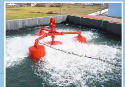
Aérateur de surface flottant type ASP-V. Instalación de aireador de superficie modelo ASP-V, versión flotante.