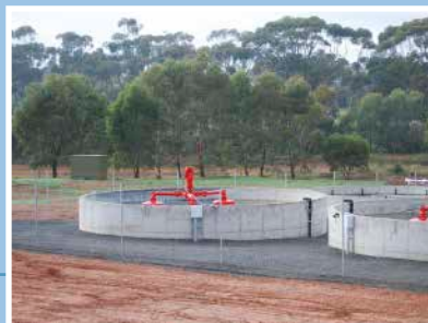
Aérateur de surface flottant type ASP-V. Instalación de aireador de superficie modelo ASP-V, versión flotante.